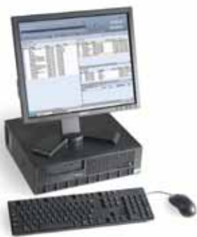
Xerox® FreeFlow® Print Server

Uw Xerox-vertegenwoordiger kan u helpen bij het uitzoeken van de opties die het best bij uw bedrijf passen.