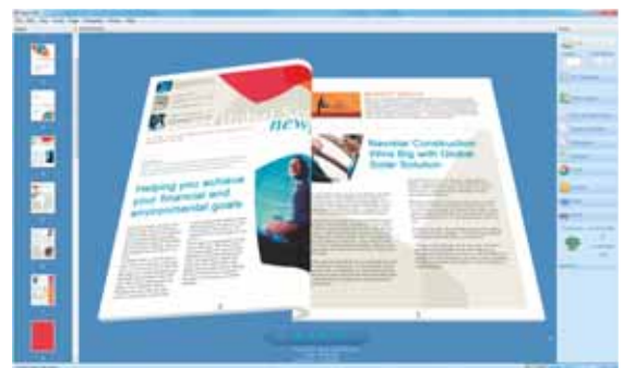
Xerox® Integrated Fiery® Colour Server