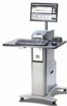
Xerox® EX Print Server, Powered by Fiery®